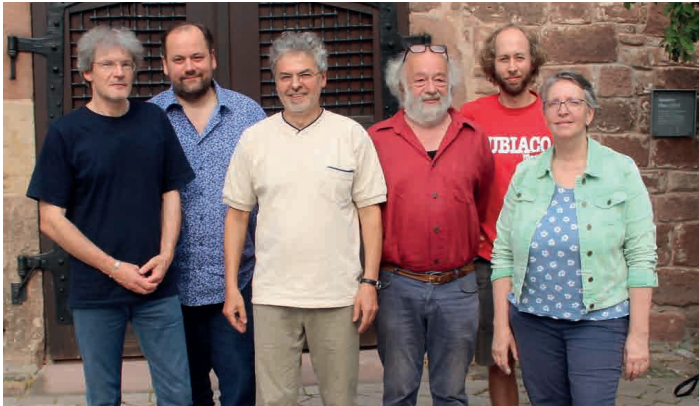
LKK – Landesverband Kommunale Kinos Baden- Württemberg im BkF – Bundesverband kommunale Filmarbeit e.V.

Kollnau. Wie beschrieben, sind solcherart Kultureinrichtungen in den Focus von Förderprogrammen geraten. Vorhandene Strukturen sollen weiterentwickelt, Ausstattungen und Modernisierungen unterstützt, Rahmenbedingungen verbessert werden. Zusammen mit dem Verein werden wir, der LKK – Landesverband Kommunale Kinos Baden-Württemberg als Netzwerk, dahingehende Ausschreibungen der BKM – Bundesbeauftragten für Kultur und Medien, der FFA – Filmförderungsanstalt, des MWK – Ministeriums für Wissenschaft Forschung und Kunst und der MFG Filmförderung Baden-Württemberg beobachten und für Waldkirch nutzen. Denn: Das Kino lebt!